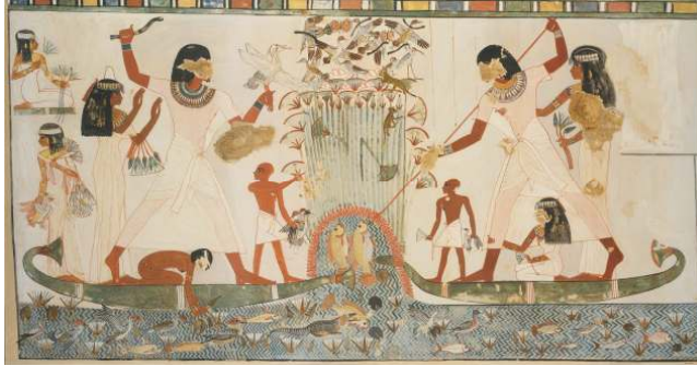
شكل ( ٢ ) منظر الصيد والقنص بمقبرة مننا - الأقصر . نقلا عن

(١) الصيد والقنص : ( لوحة الصيد والقنص بمقبرة " مننا " - الأقصر ) .