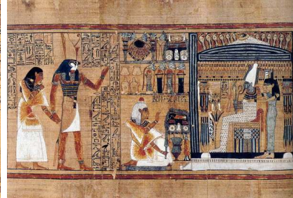
شكل (١١) الحدث الأول محكمة الموتى - طيبة - بردية